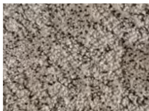
SALE / PEPE