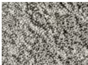
WHITE / SAGE